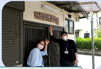
通いの場立ち上げサポート