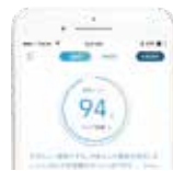
[アプリ画面 (サンプル)]