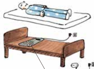
布団やマットレスの下に設置

ご利用いただく睡眠センサーは、お布団やマットレス下に敷き、電源プラグをコンセントに差し込むだけ。ルーターの電源も、同じ部屋のコンセントに差し込んでください。電気代はご負担いただけます。