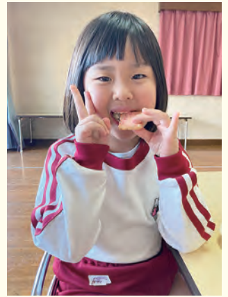
▲給食でヒノヒカリを美味しくそ うに食べる北保育所の児童