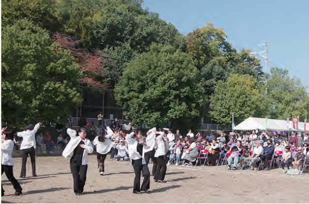
▲天理高等学校ダンス部

秋空の下、長柄運動公園で「天理じゃんじゃん市」が開催されました。天理高等学校ダンス部や朝和&柳本バトントワリングによる演技が披露されたほか、豪華景品が当たる抽選会も実施。会場には特産品・飲食の販売などがあり大勢の人たちでにぎわいました。