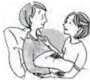
「イラスト提供：日本ユマニチュード学会」

ユマニチュードは、フランス発祥のケア技法で「人間らしさを取り戻す」という意味が込められています。高齢になり認知機能が衰えてくるとケアを拒否したり、攻撃的になることがあります。「見る」「話す」「触れる」「立つ」という人間の特性に働きかけ、「あなたは大切な存在です。」と伝えることで互いに尊重し、ポジティブな関係を築くことができるケア技法です。認知症ケアを学びたい人や介護をしている人などケア技法に興味のある人はぜひ参加ください。