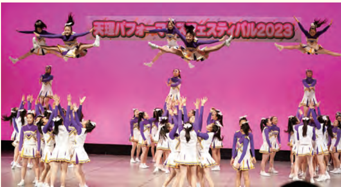
▲梅花中学校・高等学校チアリーディング部 レイダース

やまのべホール（市民会館）で、天理パフォーマンスフェスティバル 2023 が開催されました。今年で開催 10 回目の記念大会となった今大会は、一般の出演団体 34 チーム、総勢 600 人以上が出演。ジャンルもヒップホップやご当地体操に和太鼓など、子どもから大人まで幅広く楽しめるプログラム内容で構成され、それぞれが迫力の舞台を演じ会場は熱気に包まれました。