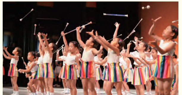
▲TLB ☆ Rainbow