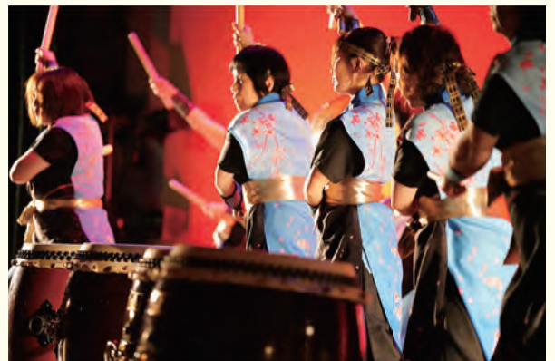
▲天理和太鼓倶楽部猛鼓会