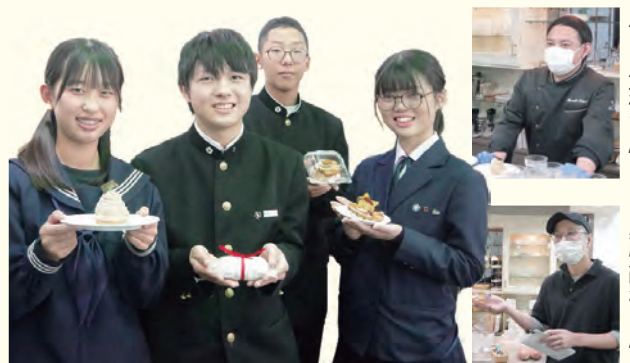
▲天理中学校・高校の生徒たち

市内の洋菓子店「パティスリーヒサソ」とパン屋「ベーカリー西村工房」が、天理のサツマイモを使用した新商品を開発。そのお披露目会がパティスリーヒサソ店舗内にて行われました。使用するサツマイモは杣之内町の自治会有志が生産。10月に天理中学・高校の生徒たちや子ども会のメンバーとともに収穫しました。新商品を早速試食した生徒たちは「甘さ控えめでサツマイモ本来のおいしさが味わえた」と大絶賛！新商品の売り上げの一部は地域のために寄附される予定です。