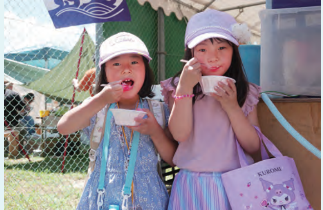
▲かき氷をおいしそうに食べる女の子

福住町で第25回 福住氷まつりと七月市が開催されました。氷まつりでは、古代の氷の貯蔵庫「氷室」を再現した復元氷室から、今年2月11日に貯蔵した3トンの氷の残氷を取り出し、荷車に載せて地元の子どもたちが旧福住中学校まで運びました。同日に旧福住中学校で開催された七月市では、福住産三年晩茶「里山三年晩茶」の販売が行われるなど様々な屋台が立ち並び買い求めるお客さんで賑わっていました。