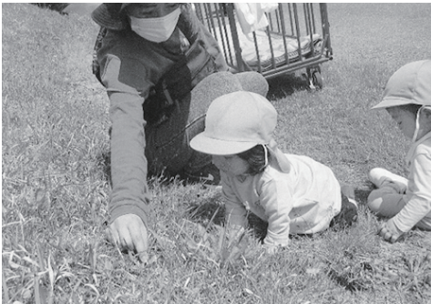
▲「たんぽぽの花をみつけたよ」

また福住小中学校と連携しながら、就学前教育の場として学びを大切に『一人一人が元気で生き生き輝く子どもの育成』を目指しています。