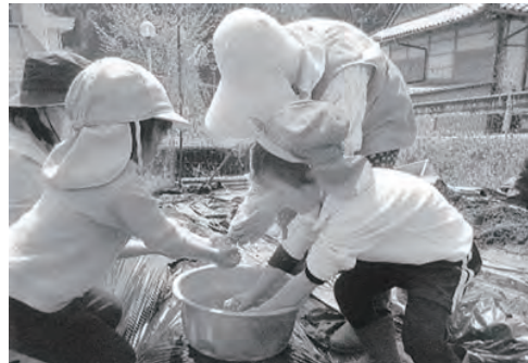
▲地域の人と一緒に野菜作り