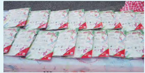
▲商品化された「里山三年晩茶」

福住町で第25回 福住氷まつりと七月市が開催されました。氷まつりでは、古代の氷の貯蔵庫「氷室」を再現した復元氷室から、今年2月11日に貯蔵した3トンの氷の残氷を取り出し、荷車に載せて地元の子どもたちが旧福住中学校まで運びました。同日に旧福住中学校で開催された七月市では、福住産三年晩茶「里山三年晩茶」の販売が行われるなど様々な屋台が立ち並び買い求めるお客さんで賑わっていました。