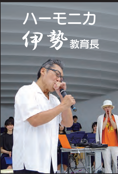
ハーモニカ 伊勢 教育長

MOS=Music Omotenashi Sisters 吹奏楽とダンスを融合させた「ブラダン」が魅力。 アメリカのオーディション番組「America's Got Talent」に出演。