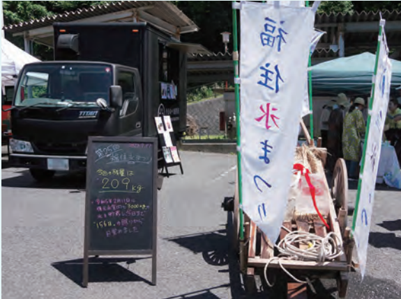
▲復元氷室から取出された氷の残量 (209kg)