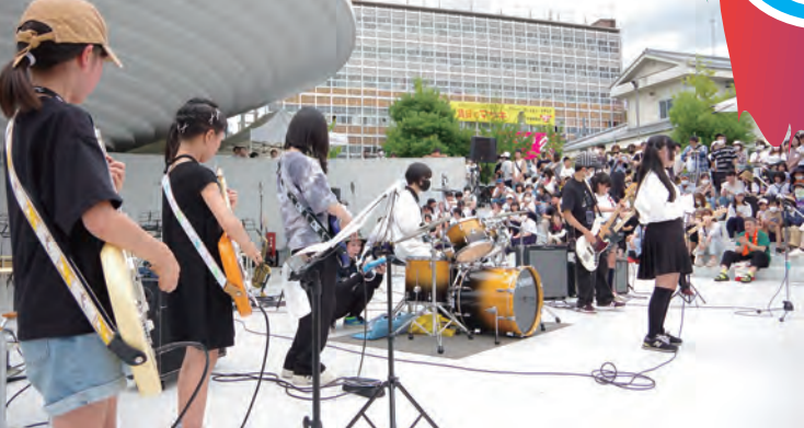
福住小中学校 音楽部