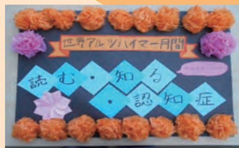
(天理大学 医療学部看護学科学生作)