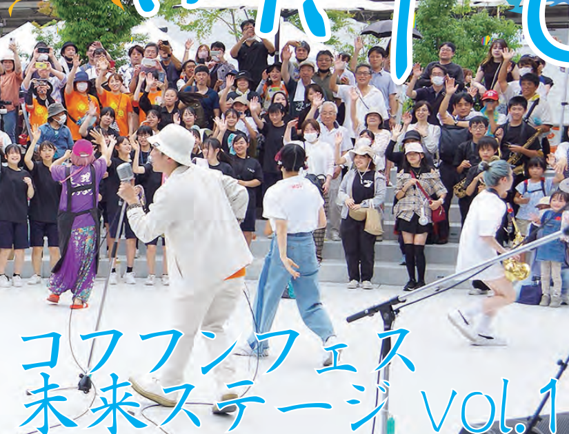
コフファンフェス 未来ステージ vol.1