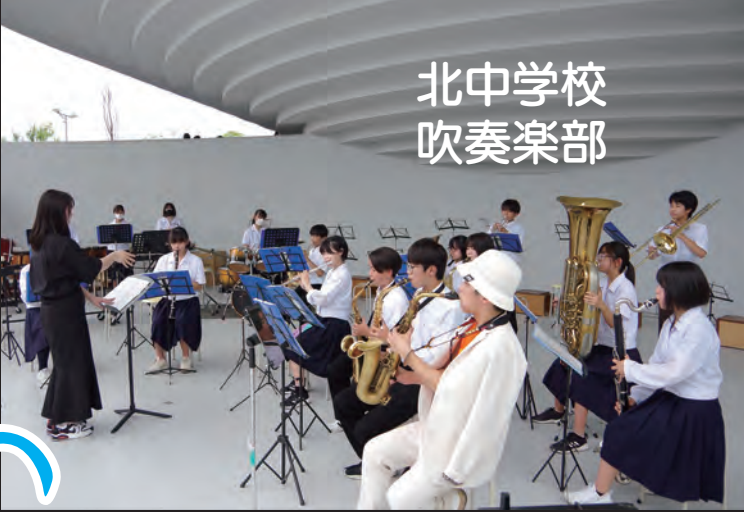
北中学校 吹奏楽部