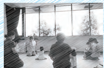
▲ハンカチでいいいいないばあ！（写真は過去のものです）