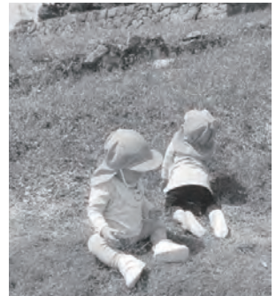
▲ハイハイして登っている

園庭開放を行っていますので、気軽に見学してください。月曜日～金曜日（9時30分～11時30分）