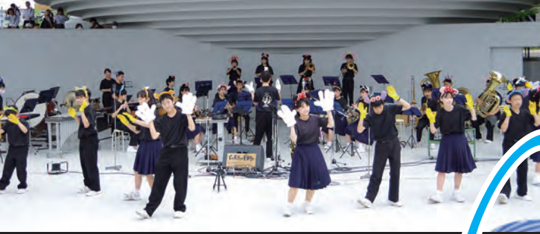
天理中学校 吹奏楽部