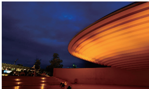
▲写真は2022年のものです

日時 9月2日(土) 19時～20時30分 認知症に対する正しい理解を啓発するため、認知症サポーターの証であるオレンジリングにちなんで、「ステージコフフン」をオレンジ色にライトアップします。