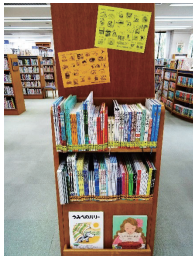
▲夏休みの読書ラリーの特集コーナー

ほかにも、夏に人気の「こわ〜いおはなし」、夏休みの宿題を応援する「工作・自由研究の本」、大人から子どもまでを対象にした「SDGs関連の本」、「戦争と平和を考える本」など、いろいろなテーマを取り上げて、紹介しています。