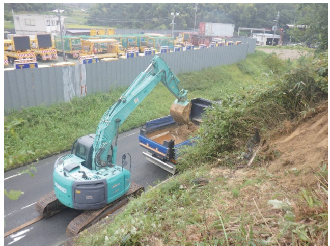
▲▼重機を用いて道路への土砂崩落を応急復旧する様子▼▲