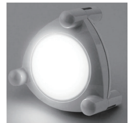
▲ソーラーライトイメージ画像

日時 8月20日(日) 13時30分～16時30分 場所 文化センター4階視聴覚室 内容 ソーラーライト作りと家庭の省エネ、光熱費節減につながる環境家計簿体験 対象 市内在住・小学生3～6年生(保護者同伴)、及び中学生 定員 15組(先着順) 費用 500円(ソーラーライト工作代) ☆持ち帰りできます 持ち物 スマホ ☆Wi-Fiを利用できます 申込み・問い合わせ 8月10日(木)までに直接、または電話で環境連絡協議会事務局(環境政策課内)(☎内線 269)