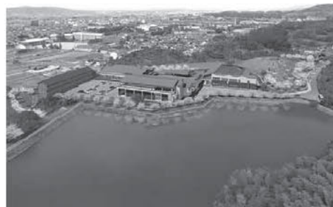
【なら歴史芸術文化村】完成イメージ

7月4日、奈良県と天理大学との間において、なら歴史芸術文化村に関する連携協定が締結されました。