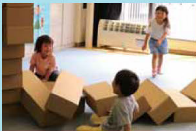
▲ダンボールを倒すのたのしいね！