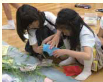
かざり作り 楽しいね!

中国・上海市の小学生23人が来校。1年生と七夕飾りを作った後は5年生と一緒に給食を食べました。お互いの文化や生活の違いを知るきっかけになりました。