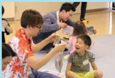
▲パパ、なに作ってるの？