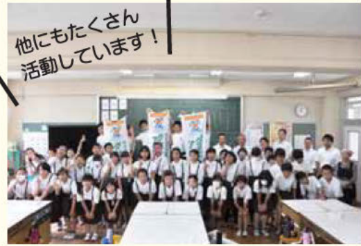
他にもたくさん活動しています!

験が行われました。各学校の児童達は、最初は慣れない足元に苦戦していましたが、コツを掴むと楽しそうに苗を植えていました。 その他にも、丹波市小学校では天理参考館の学芸員による出前授業が、井戸堂小学校では中国の学校から来た児童との交流会など、各校で特色ある授業が行われています。