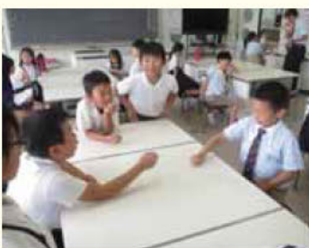
▲“じゃんけん”ってどうやるんだらう?