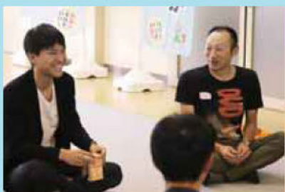
▲話し足りない！パパ達の座談会

座談会では、子ども達との接し方や家族のことなど、予定時間いっぱいまで語るパパ達の姿が見られました。