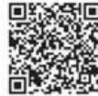
事前申込みフォーム

事前申込みフォームまたは、電話(☎0742-20-1800)で申込みし、当日、チケットブースにて市内在住・在勤・在学である証明(広報紙、運転免許証、健康