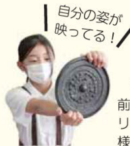
自分の姿が映ってる!