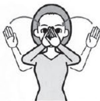
掌を前へ向けた両手を左右から引き寄せ、目の前で交差させ、