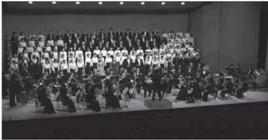
▲オーケストラと一緒に歌いましょう♪