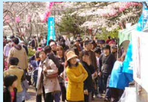
◀ ③天理の春の訪れを喜ぶ 天理の春の訪れを喜ぶ