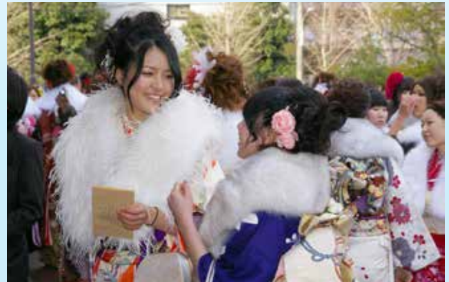
▲ ①成人記念式 懐かしい友達と再会