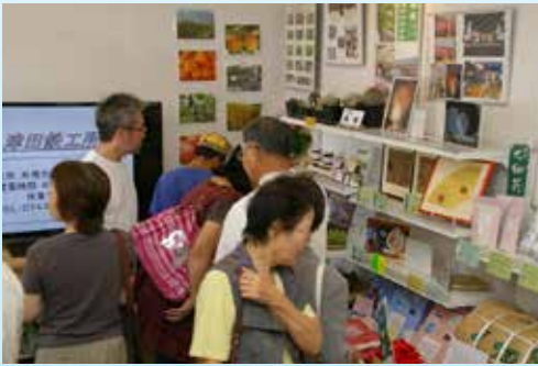
▲⑧天理市観光物産センター（ナビ天理）オープン 天理の魅力を市内外へ発信!!