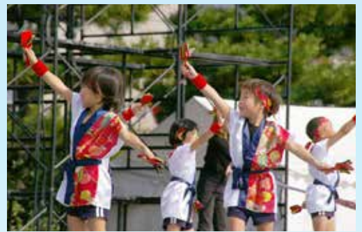
▲⑨天理な祭り 元気な踊りで観客を魅了!!