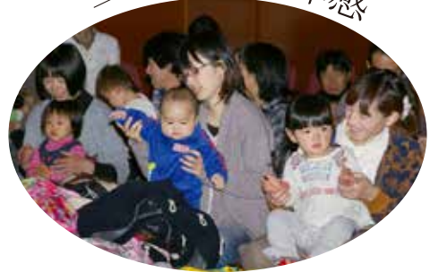
▲一緒に音楽を楽しむ親子たち