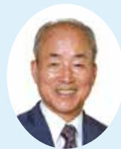
天理市長 南 佳策