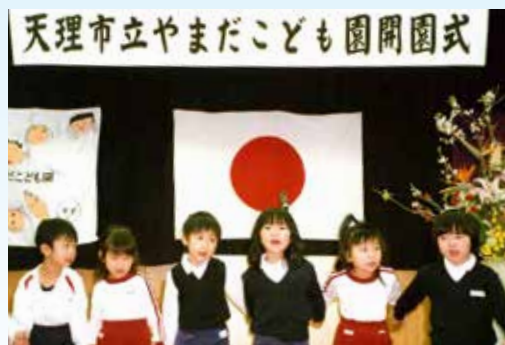
▲ ⑤やまだこども園開園式 新しい歴史の1ページ