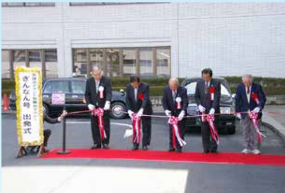
▶ ④デマンドタクシー運行開始 市民の新たな交通手段として活躍