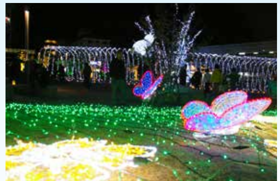
▲⑪光の祭典 県下最大級・22万球のイルミネーション