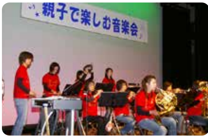
▲クリスマスソングを披露

12月1日、文化センターで「親子で楽しむ音楽会」が行われました。 子どもたちは、工夫をこらした演奏や歌に合わせて、手をたたいたり、体を揺らしたりと生の音楽に親しんでいる様子で、日頃は忙しいお父さん、お母さんと一緒に楽しい時間を過ごしていました。