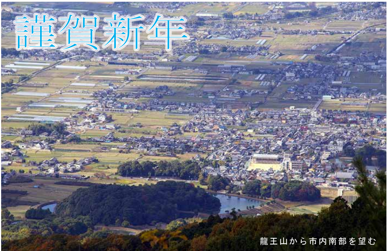
龍王山から市内南部を望む