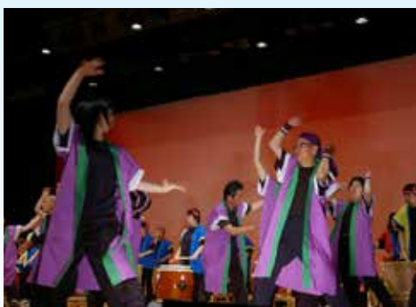
▲ ⑥やまびこコンサート 会場を沸かせた踊りと太鼓の音色