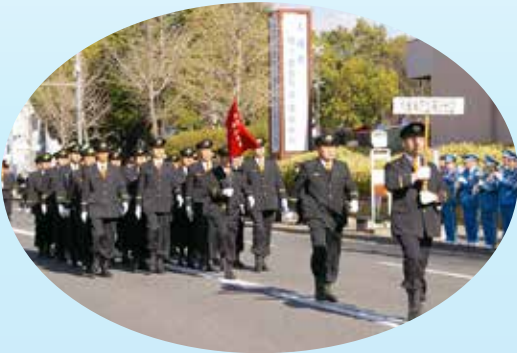
▶ ②消防出初式 市民の安全・安心を守る