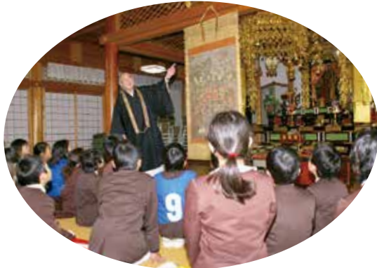
▶ 郷土の文化財について説明する蔵福寺の住職

2月11日、福住町井之市にある復元氷室で「氷入れ」が行われました。今年も3トンの氷が地域の人たちの手によって、氷室の中に運び込まれていきました。