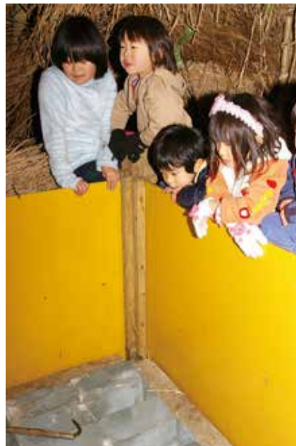
▶ 氷室の中に納められる氷に興味津々!!