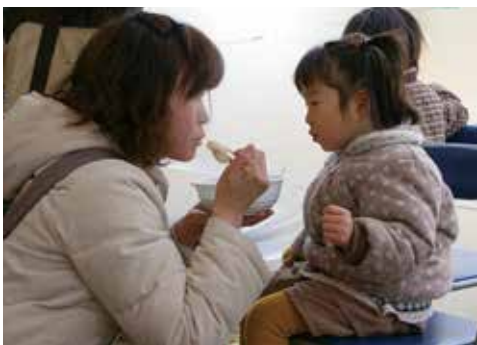
▲ふるまわれた豚汁を味わう親子