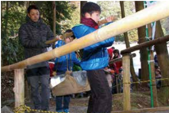
▲大人から子どもまで力を合わせて氷を運搬

氷室に納められた氷を眺めながら、子どもたちは「氷がたくさん残りますように」と願っていました。