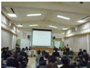
指定研究員の先生が研究の成果を発表

今後、この指定研究員制度を充実させ、天理の子どもたちがたくましく生き生きと学ぶ喜びを実感できる教育の創造に努めていきたいと考えています。