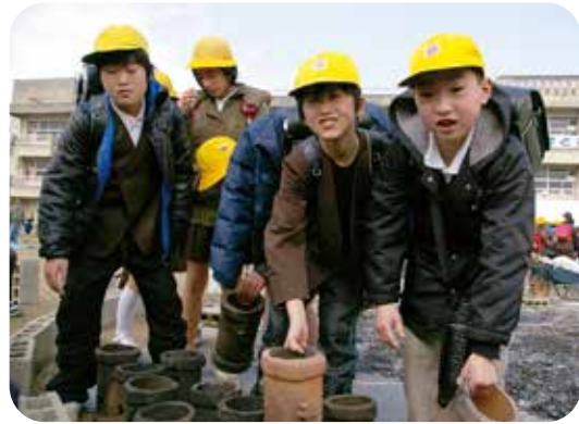
▶ 野焼きから取り出した円筒はにわを手にする児童たち