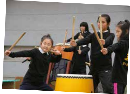
▶ 迫力ある太鼓の響きで祭りがスタート

2月2日、樺本小学校で「はにわ祭り」が行われました。この祭りは、町おこしの事業として行われており、今回で14回目になります。 当日は、太鼓の演奏のあと、5年生児童が製作した「円筒はにわ」の野焼きがありました。「探検ウオークラリ」では、1年生から5年生まで、楯神社や蔵福寺、小墓古墳など校区内にある史跡を探訪。また、体育館では、樺本幼稚園の園児たちが、長寿会の人たちと一緒に、コマ回し、けん玉といった昔のあそびを体験し、参加者全員が地域の歴史やつながりを実感できた一日となりました。