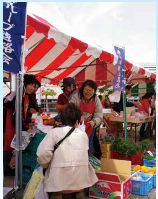
▲③にぎわいマーケット 天理の農産物など買い物客でにぎわう