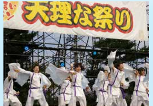
▲ ⑦ 天理な祭り 仲間と息を合わせ、観客を魅了!!