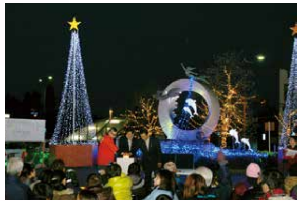
▶ カウントダウンの後、一斉にイルミネーションが点灯

県下最大級の約25万球で彩る「光の祭典」の点灯式が12月1日（点灯期間は来年1月18日まで）、天理駅前広場で行われ、イルミネーションの光で華やかに演出されました。