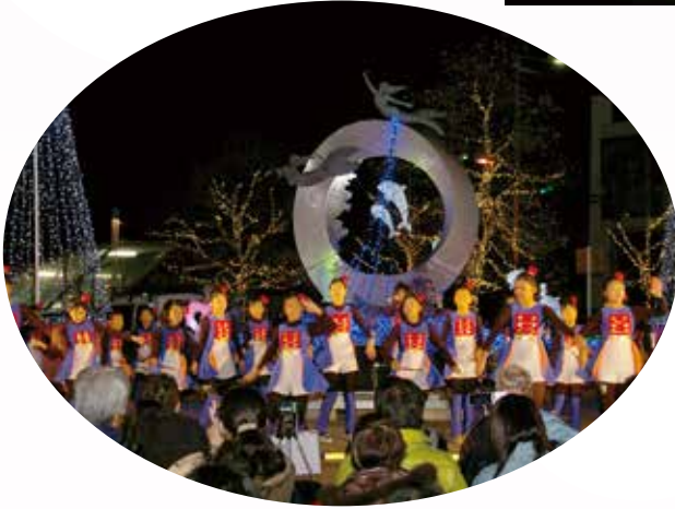
▶ 会場を盛りあげる小学生のバトントワリング部の皆さん