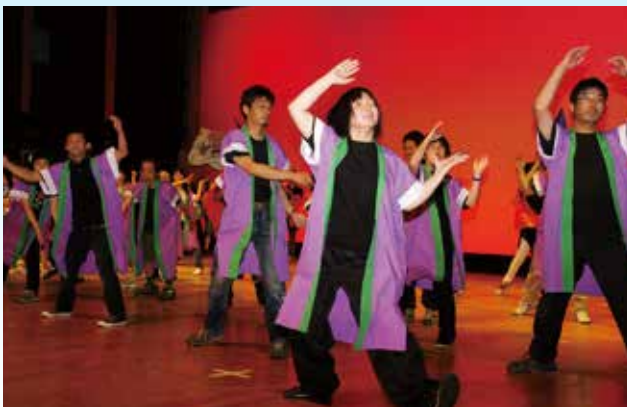
▶④やまびこコンサート 伸び伸びとした演舞を披露