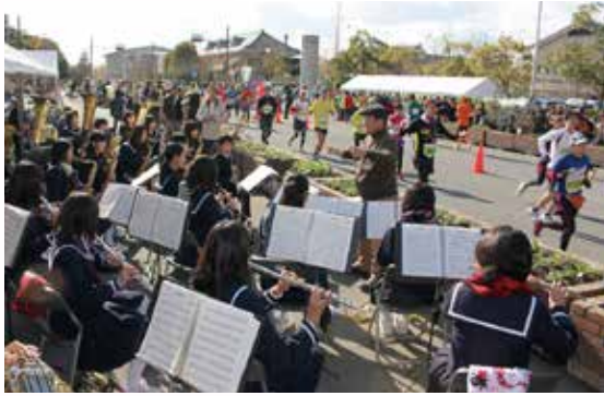
▲天理中・南中・西中・北中学校による吹奏楽部の応援演奏