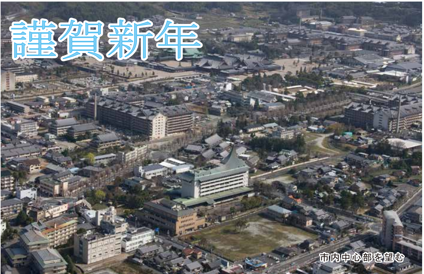
市内中心部を望む