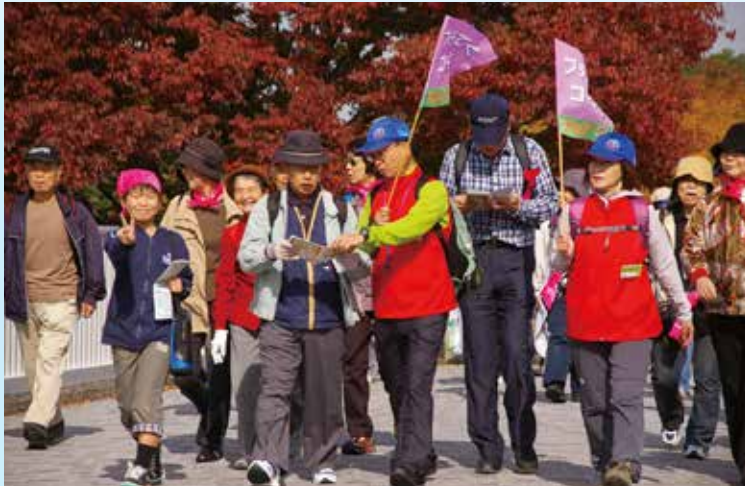
▲ ⑧ てくてくてんり「秋」ウォーキングフェスタ2013 天理の秋を満喫