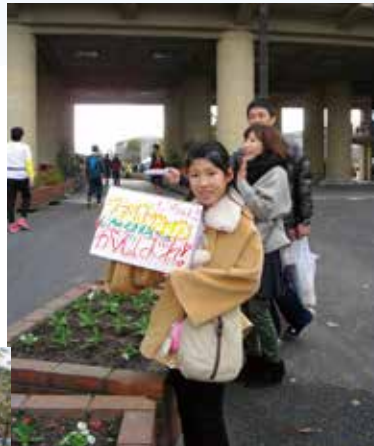
沿道の応援はランナーの背中を後押し

市内の沿道には、ランナーを応援しようと大勢の観客が駆けつけ、力走するランナーに熱い声援を送っていました。