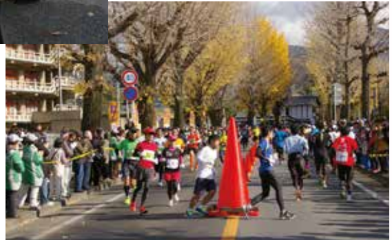
▲折り返し地点では大勢の観客が大声援