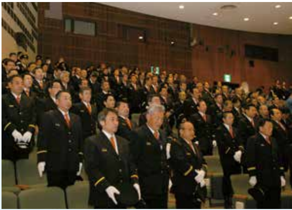
▶①消防出初式 市民の安全・安心を守る