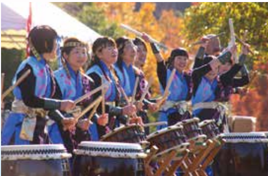
▶力強く和太鼓で応援する猛鼓会の皆さん