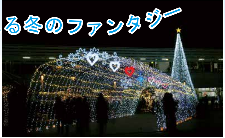
◀ 広場の中央に設けられた光のトンネル