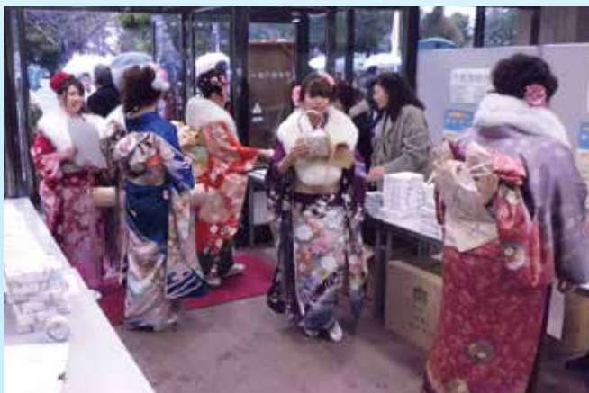
▶②成人記念式 二十歳のお祝い、決意新たに！