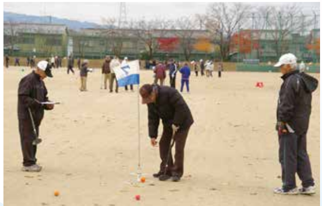
▶ 狙いどおり入ると足どりも軽やか

11月28日、「長寿会50周年記念グラウンド・ゴルフ大会」が健民運動場で行われ、460人の選手が元気いっぱい練習の成果を競い合いました。 ゲームが始まると、ホールポストに向かって、集中力を高めていく選手たち。 前日の雨でグラウンドが水を含み、ボールがイメージどおり転がらず苦戦する場面も。足元の悪いなか、見事ホールインワンが出ると、チームから拍手が沸き起こり、お互いの健闘をたたえ合っていました。