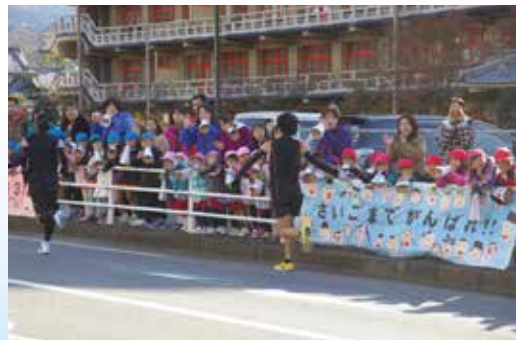
▲手作りの看板を掲げ声援を送る山の辺幼稚園の園児