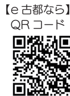
【e古都なら】QRコード ▲「びよびよ教室」はこちらから申込みできます