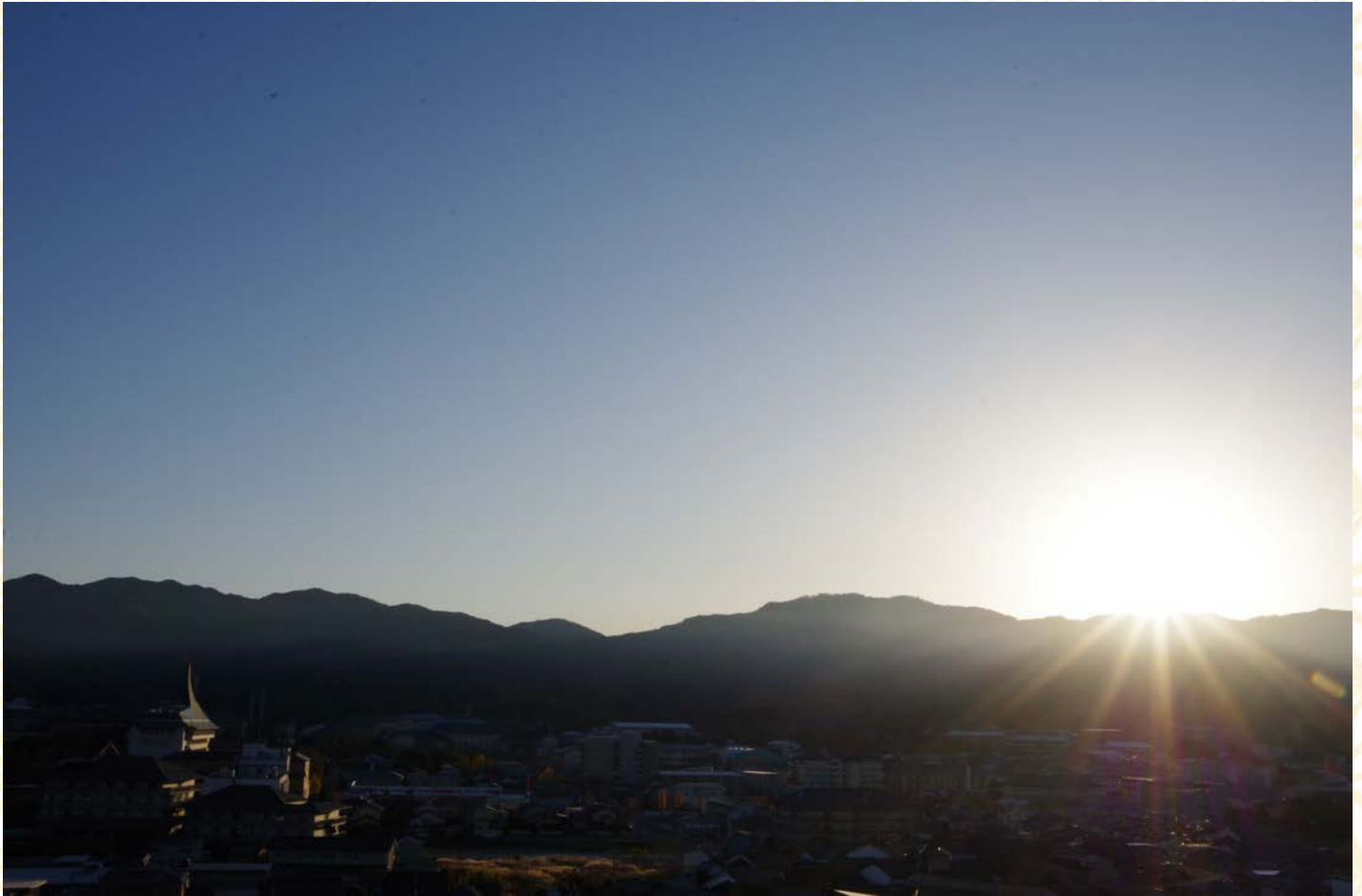
許可を得て撮影しています