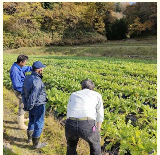
▶「あじまるみ大根」栽培の様子