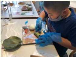
▲柿の葉寿司の手づくり体験