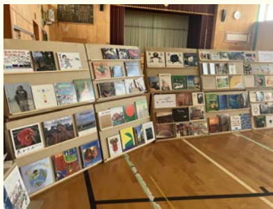
▲体育館では、絵本の表紙を見せて並べ、子どもたちが自由に読みたい絵本に出会うことができる「絵の本ひろば」を開催