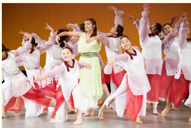
▲天理大学創作ダンス部

天理の一大パフォーマンスイベント「天理パフォーマンスフェスティバル2022」が3年ぶりに開催されました。会場となった市民会館では様々なジャンルのパフォーマンスが多世代の演者により披露されたほか、全国レベルで活躍するゲストが出演しました。