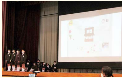
▲3年生「櫛本のステキを見つけよう」の発表