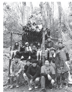
▲作製中のツリーハウスの前で ※写真撮影時のみ、マスクを外しています

「自然」という、常に変化し、思い通りにならない環境には多様な学びがあり、森の恩恵を受けて育った子どもたちが、森と離れた時も、森を思い森から川へ、川から海へ、海から大気へと巡る循環のなかに、「自分」という存在を重ね合わせられることを願い活動しています。