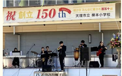
▲運動場でのステージパフォーマンスでは、北中吹奏楽部の演奏などが行われました