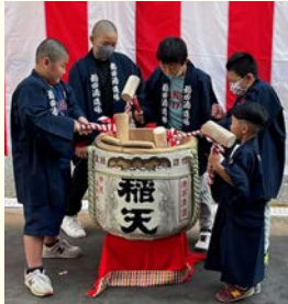
▲日本酒鏡開き体験

この他、天理市の観光スポットを訪れ、柿の葉寿司「平宗」で柿の葉寿司の手づくりを体験、石上神宮では絵馬を奉納、稲田酒造では日本酒鏡開き体験や大一電化社による出張ラテアート体験、また、天理観光農園では餅つき体験を楽しみました。