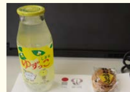
「ゆずっこ」と「鶏卵饅頭」