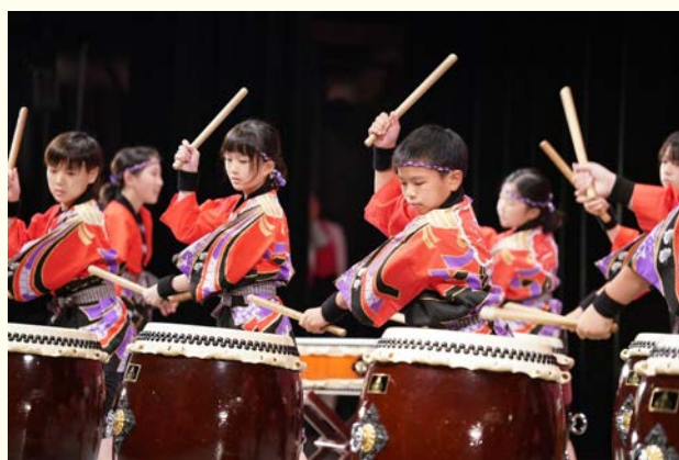
▲天理子ども和太鼓教室（猛鼓会）