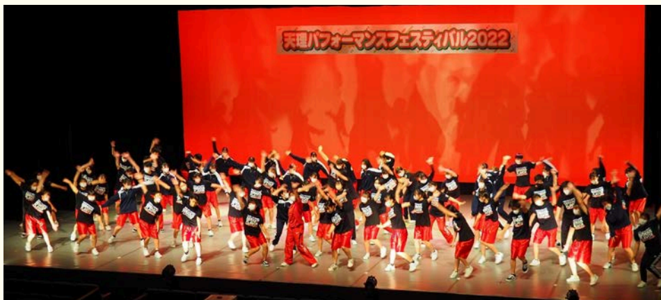
▲スペシャルゲスト：三重高等学校ダンス部

天理の一大パフォーマンスイベント「天理パフォーマンスフェスティバル2022」が3年ぶりに開催されました。会場となった市民会館では様々なジャンルのパフォーマンスが多世代の演者により披露されたほか、全国レベルで活躍するゲストが出演しました。