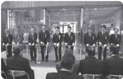
▲テープカットの様子