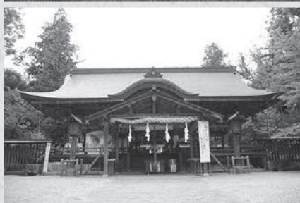
上 佐保庄町付近からみた龍王山 下 紅しで踊りが行われる大和神社