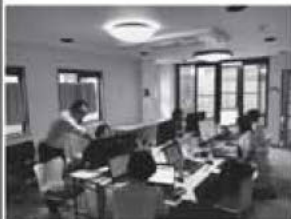
前期日程集合研修の様子