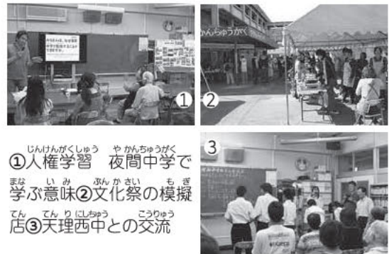
①人権学習 夜間中学で 学ぶ意味②文化祭の模擬 店③天理西中との交流

随時、入学を受けつけていますので、ことばや文字の読み書きで困っている人、学校で十分学べなかった人は相談にお越しください。