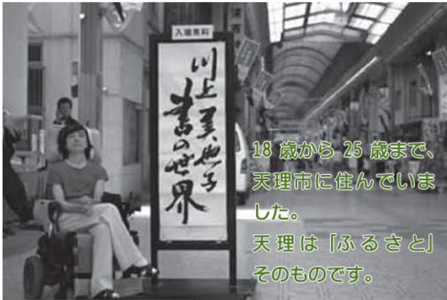
18歳から25歳まで、天理市に住んでいました。天理は「ふるさと」そのものです。