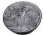
カツ丼 630円 ※土日は500円