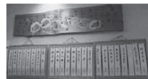
豊富なメニューの中からお気に入りの一品を見つけるのも楽しみの一つ

「お客さんから家に帰ってきたみたいで落ち着きます。と言われた時は嬉しかったですし、そういった存在であり続けたいですね」と店主は笑顔で話していました。