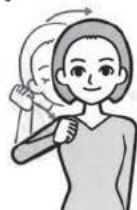
こめかみにあてた右手拳を下ろすと同時に頭をおこす

学校や職場など仲のいい友達同士の場合は、【おはよう】の手話は使わずに、片手を上げたり、ハイタッチを朝の挨拶にしています。この手話には、その他【朝】【起床する】【目覚める】などの意味があります。