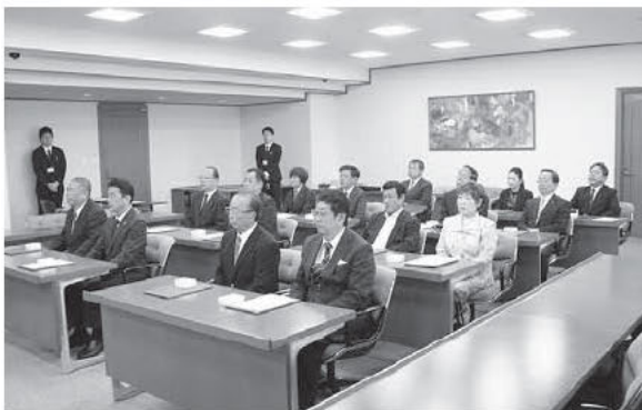
◀ 4月22日に行われた 当選証書授与式の様子

各投票区の投票者数及び投票率は、期日前投票所における投票区別の投票者数を加算し算定した数字です。