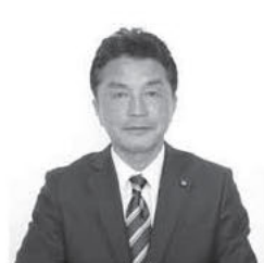
おおはし もとゆき 大橋 基之 自由民主党 (60) 富堂町