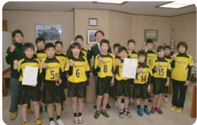
▲全国大会への出場を決めたパワフルジュニア

小学生ドッジボール選手権奈良県大会で優勝を収めた「パワフルジュニア」が、並河市長に報告するため、3月10日、市役所を訪れました。 パワフルジュニアは二階堂小学校を拠点として活動するチームで、全国大会出場は3回目。昨年夏の全国大会では準優勝を掴みました。春の全国大会出場に向け、市長は「チーム一丸となって、ぜひ優勝を目指して頑張ってください」と選手にエールを送っていました。