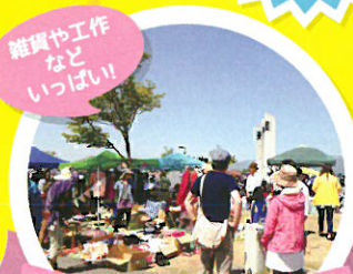
広場で大集合!ブース出展