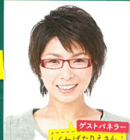
ゲストパネラー くわばたりえさん (お笑い芸人)