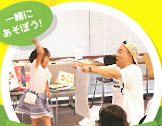
親子でふれあい遊び!