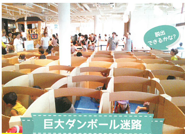
巨大ダンボール迷路