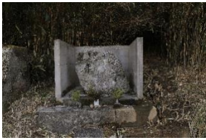
〈 梵字石仏 〉

そのあたりの小字名を「ショウブ」と言う。地名の由来はわからない。「勝負事」に御利益があるのかと思うがそうでもない。なんでも、腰から下の病に御利益があるそう。それで、わら草履を供えたりしたようだ。