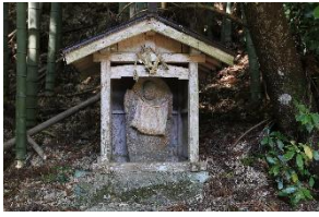
〈 ショウブの地蔵 〉