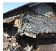
緊急代執行を要する 崩落しかけた屋根