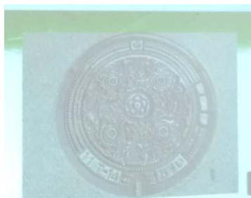
さんかくぶちしんじゅうきょう 黒塚古墳の「三角縁神獣鏡」