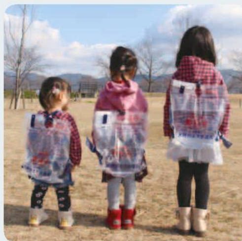
上下水道局では、災害時に避難所(小学校等)で給水袋に水を入れて配布します。