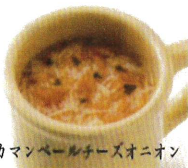
カマンベールチーズオニオン