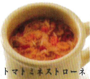
トマトミネストローネ