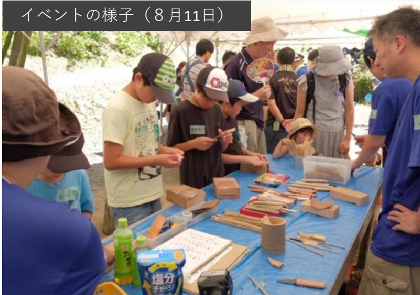
イベントの様子（8月11日）