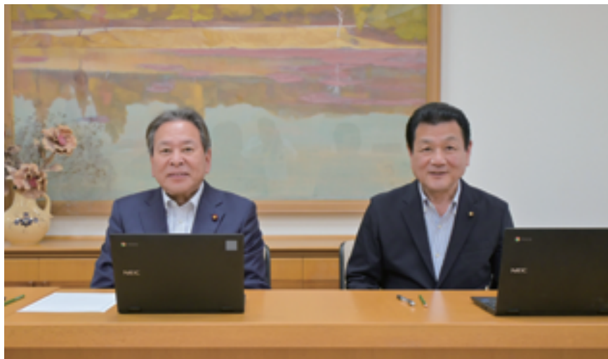
(写真) 左：鳥山副議長 右：榎堀議長

文教厚生委員会 (福祉に関することや、保育・学校教育など子育て・教育分野全般についてを審査)