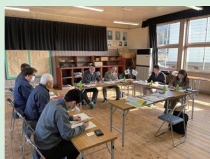
茨城県石岡市議会