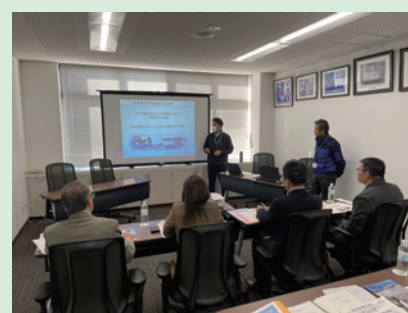
茨城県常総市議会