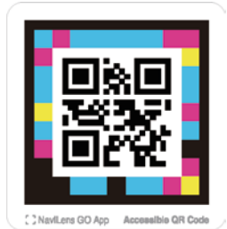
「ナビレンス」のホームページはこちら

A 現在の利用者は31名。今後モバイル型を志向する方の増加が予想されるため、利用条件も含めて検討する。(市長)