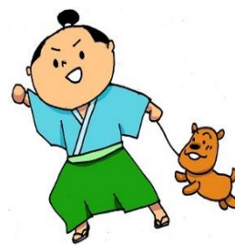
天理市健康づくりキャラクター すたこら侍 健犬(けんけん)