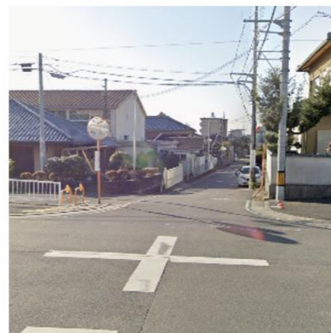
① 北ゲート手前西交差点