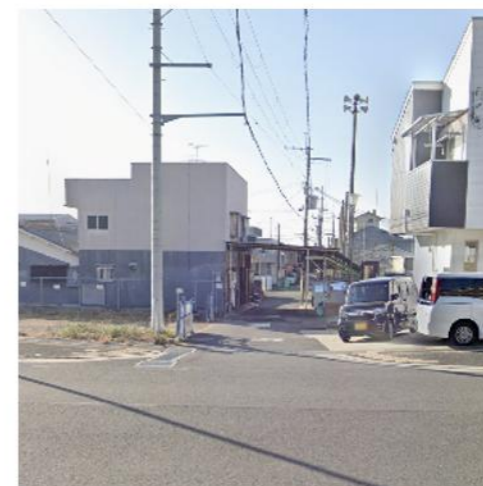
② 南ゲート手前西交差点