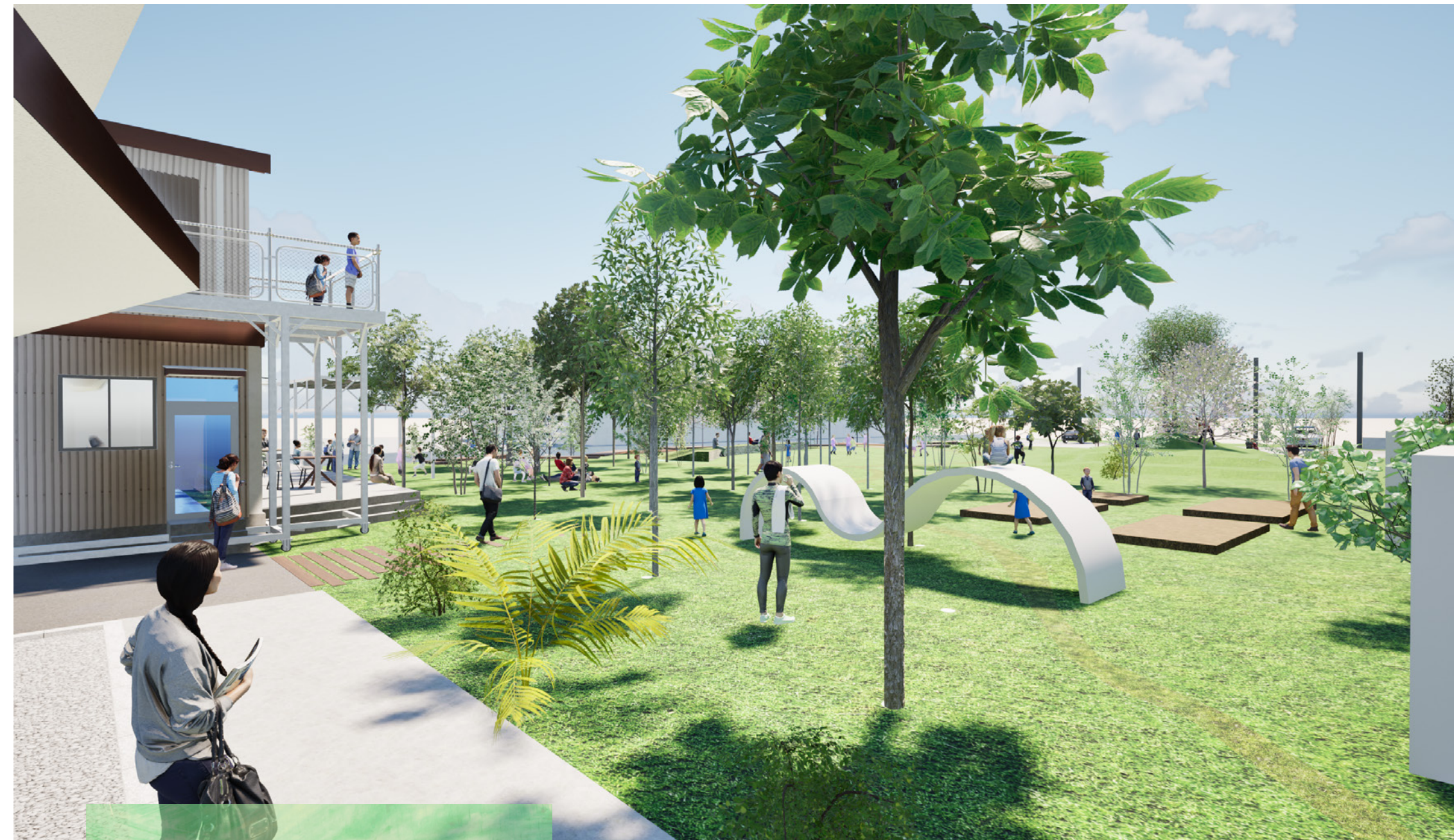
e.f.t.college of Arts 校庭イメージ図