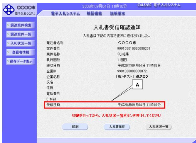
図1. 1. 入札書受信確認通知