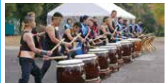
▲市民による和太鼓演奏(白川地区内中央通路)