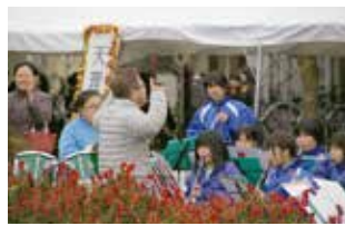
▲天理中・南中・西中・北中学校による吹奏楽部の応援演奏(天理教真南通り)