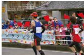
▲山の辺幼稚園児による応援(山の辺幼稚園前)