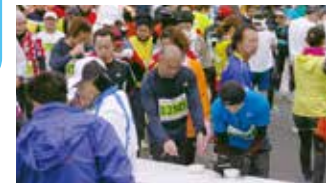
▲ぜんざいのふるまい(ランナー対象)(天理教真南通り)