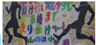
▲山の辺小学校の児童による応援看板