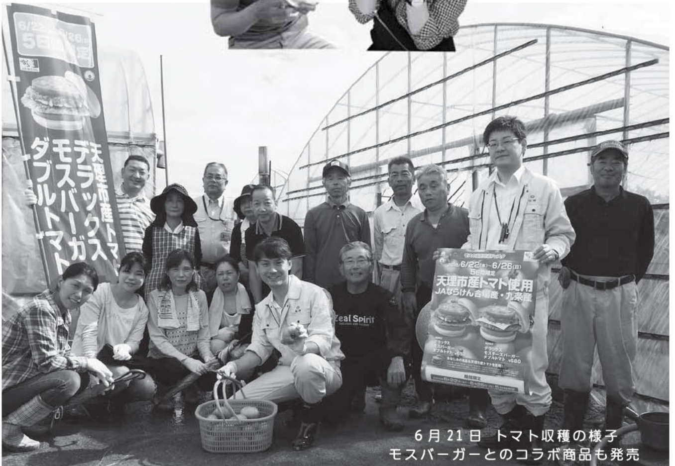
6月21日 トマト収穫の様子 モスバーガーとのコラボ商品も発売