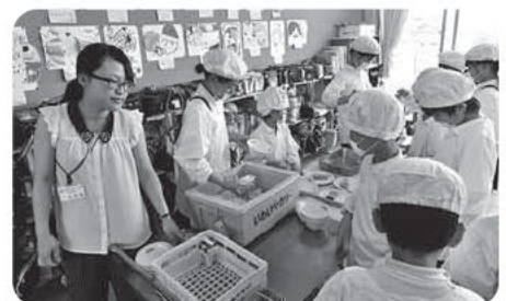
給食準備中！早く食べたい(^^)