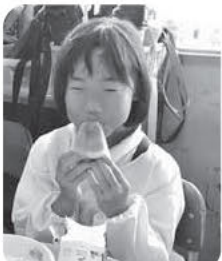
スイカも美味しい！