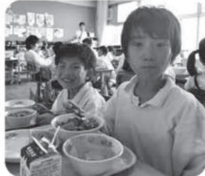
いつも給食楽しみ(^^) /