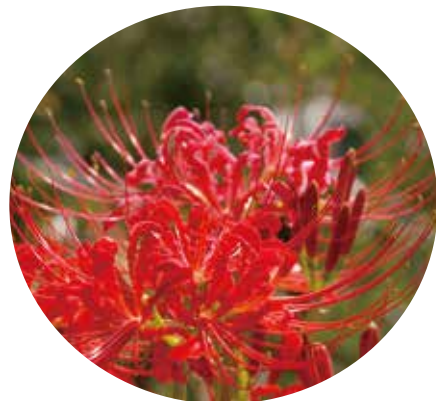
▲山の辺の道周辺にきれいに咲く彼岸花