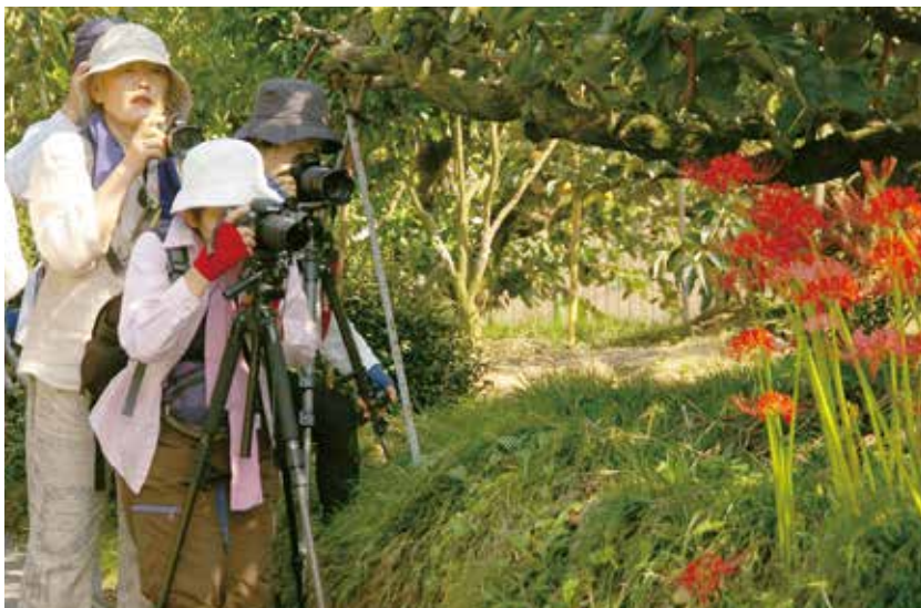
▲彼岸花をカメラに収める参加者たち