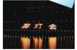
▲今秋の柳本町・柳灯会

市政をあずかり12年間。さまざまな出来ごと、感慨の中で一市民に戻らせていただきます。ご意見、励ましありがとうございます。