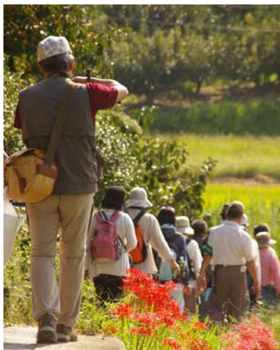
▲カメラを携えながら約3キロの道のりを歩きました

長岳寺を出発した参加者は、山の辺の道を通り道端に咲く花を撮影。途中、 ふすまだりよう 衾田陵や大和稚宮神社を巡り、撮影ポイントを見つけると、初秋の山の辺を夢中になってシャッターを切っていました。