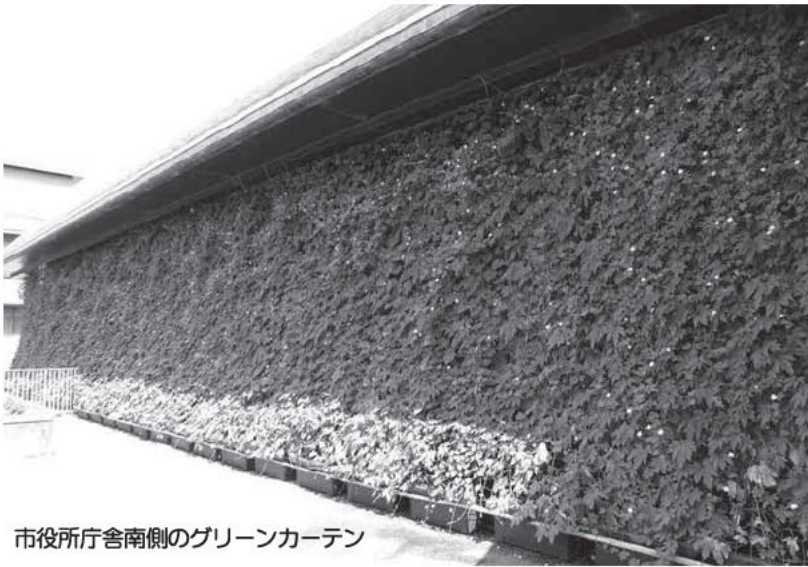
市役所庁舎南側のグリーンカーテン

天理市環境連絡協議会は市民、市民団体、事業者、行政が協働して本市の現在及び将来の良好な環境の保全と創生を目的に、昨年2月に発足しました。現在、5つの部会（緑の保全部会、ストップ温暖化部会、まちづくり・観光部会、ゴミ減量化部会、環境教育部会）が活動しています。