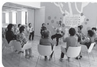
▲くらしの知恵袋～運動編～