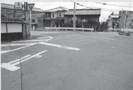
今も“車返し”の伝承地として残る田部町の交差点

また一説には、都から大和神社に向かう勅使がこの地にさしかかった時、このあたりで争いがあつて物騒だったので、難を避けてここから京都へ車を引き返しました。そこでこの地を“車返し”というようになったということです。大和神社のちゃんちゃん祭（4月1日）のお渡りに出される千代山鉾は、この勅使の代わりだともいわれています。