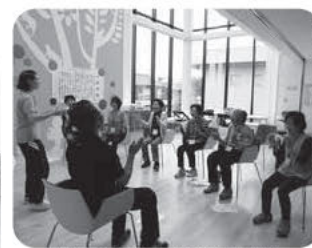
▲リハビリ教室～認知症予防の運動～