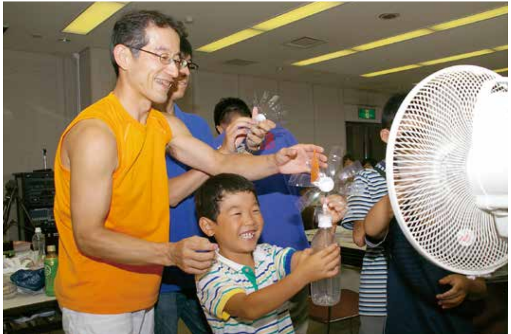
◀風を受けて、ライトが光ると思わずニッコリ