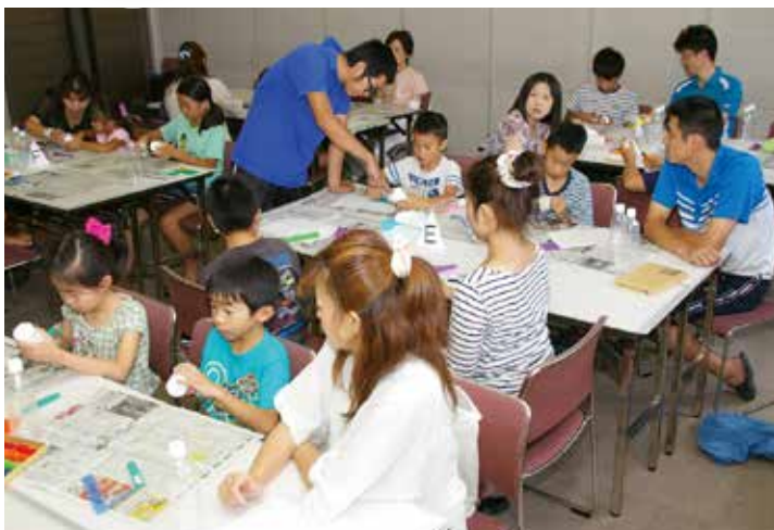
▲多くの親子連れでにぎわった工作教室

8月17日、文化センターで「キッズセミナー」が開かれました。これは、ものづくりの楽しさなどを知ってもらうために、毎年行われているものです。 今回は、風の力を光に変える「風力発電」の模型づくりに挑戦。子どもたちは、保護者と一緒に模型を作りあげていきました。模型ができあがる、子どもたちは扇風機の前に集まり、実際に光るかどうかを確認。風の力で勢いよく羽根が回ると、風車に取り付けたライトがピカピカと光り、子どもたちは大喜びしていました。