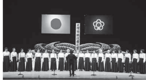
※写真は過去のもので

先の大戦において亡くなられた方々を追悼し平和を祈念するため、戦没者追悼式を開催します。新型コロナウイルス感染拡大防止の観点から、例年の内容を一部変更して開催します。来場の際はマスクの着用をお願いします。