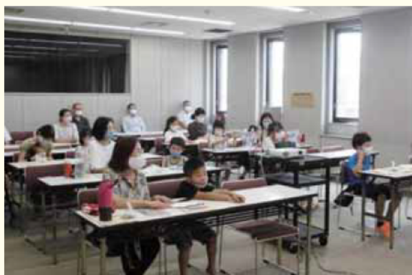
8/9 文化センターでも感染症対策を徹底し、工作教室が開催されました(主催:環境連絡協議会)

HP http://www.city.tenri.nara.jp/kakuka/shichoukoushitsu/kohoka/singata1/index.html