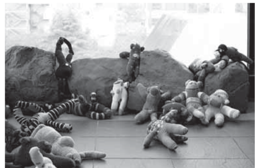
とりとめのないもの(2016)