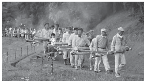
※写真は過去の虫送りの様子

子どもたちが伝統や文化を学び、地域のすばらしさやふるさとの良さを感じることを目的に、市内の子どもたちを対象に伝統や文化に触れる体験活動を行なう団体です。