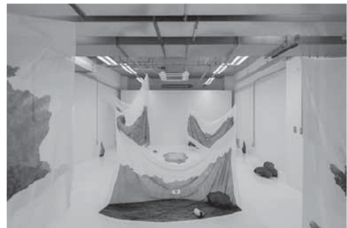
A piece for cake.(2017)

2020年「道にポケット」京都市立芸術大学ギャラリー@KCUA／京都 2019年「朝は来るのか」山中 suplex／滋賀 2019年「京都市立芸術大学作品制作展」京都市立芸術大学 2019年「群馬青年ビエンナーレ 2019」群馬県立近代美術館／群馬 2018年「大彫刻フェア」元・崇仁小学校／京都 2017年「A piece for cake in HYAKKETSU.」JR 京都伊勢丹／京都 2016年「とりとめのないもの」ギャラリーマロニエ／京都