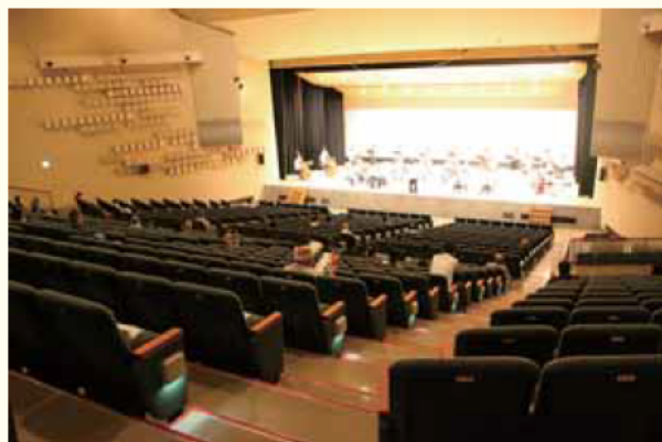
8/2 十分な距離を取り開催された天理シティーオーケストラのみなさんによるコンサート