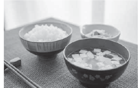
食事と健康について考えてみませんか