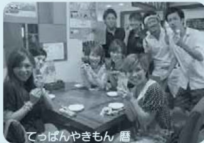
てっぱんやきもん 暦