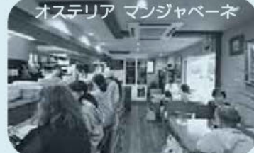
オステリア マンジャレーネ