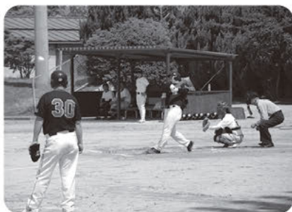
5月17日 ソフトボール競技

◆申込み・問い合わせ スポーツ振興課(☎内線551/FAX6210100/EMAIL sport-moushi-komi@city.tenri.nara.jp)で申込みください。