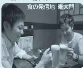
食の発信地 東大門