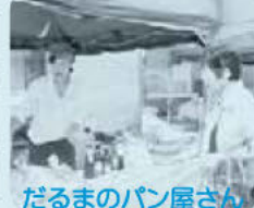
だるまのパン屋さん