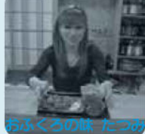
おふくろの味 たつみ