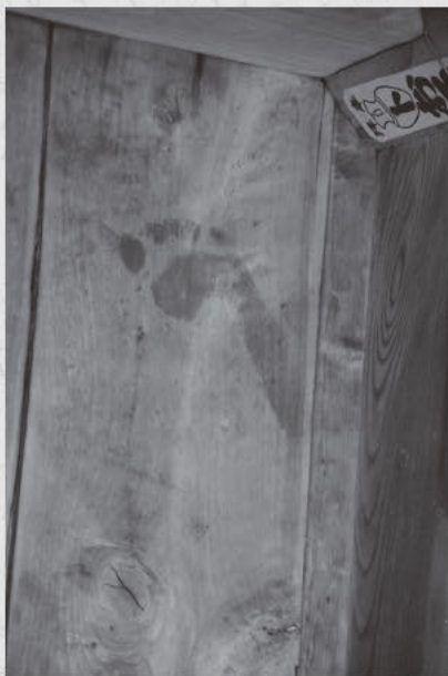
▲ 血の床が残る長岳寺