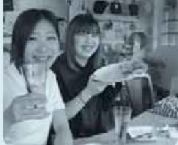
天理観光農園 cafe わわ