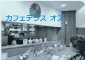
カフェテラス オソ