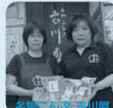
名物ごんぶ 吉川屋