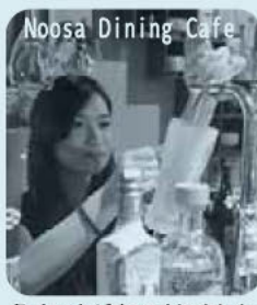
Noosa Dining Cafe