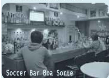
Soccer Bar Boa Sorte