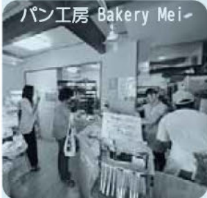
パン工房 Bakery Mei