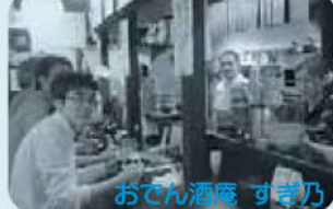
おでん酒庵 すき乃