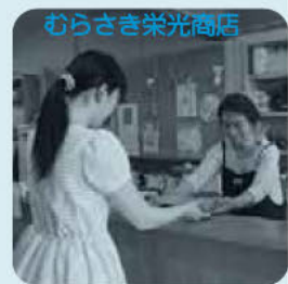
むらさき栄光商店