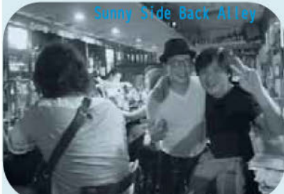
Sunny Side Back Alley