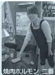
焼肉ホルモン 二番