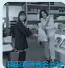
稲田酒造合名会社