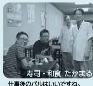
寿司・和食 たかまる

バルを通して、さまざまな 出会いや発見があった2日 間だったと思います！ 次回もお楽しみに～ (^)