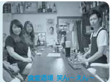
食堂酒場 笑ん〜えん〜