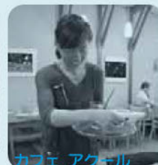
カフェ アクアール