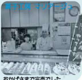
菓子工房 マリアージュ