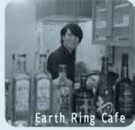
Earth Ring Cafe