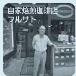
自家焙煎珈琲店 フルサト