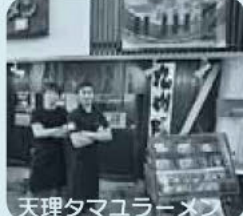
天理タムユラーメス