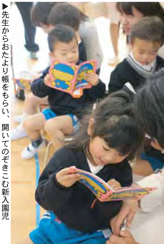
▶ 先生からおたより帳をもらい、開いてのぞきこむ新入園児