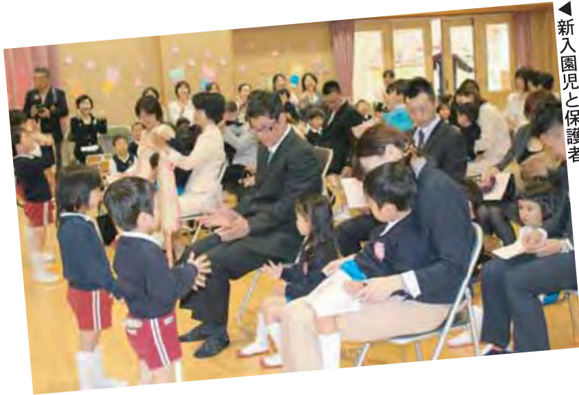
◀ 在園児の「迎える歌」を一緒に歌う 新入園児と保護者