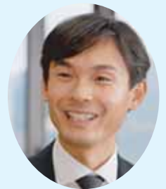
天理市長 並河 健

昭和29年4月1日に天理市が誕生してから、今年で60周年。豊かな自然と歴史・文化に支えられ、市民の皆さんとともに発展してきました。これから本市の更なる未来に向かって、皆さんとともに歩んでいきます。