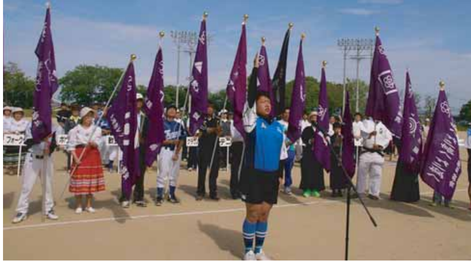
▲昨年度の総合開会式の様子

◇申込期間 4月1日(火)～16日(水) 9時～17時 ◇参加資格 市内在住・在勤・在学の人(修養科生は除く) ☆その他の競技については、次号以降に掲載予定です。 ◇申込み 各種目別に定める用紙に必要事項を記入のうえ、市民体育課(市役所5階)へ直接またはFAX(送信後に市民体育課に要連絡)、メールで申込みください。 ◆問い合わせ 市民体育課(☎内線551・552/FAX 62-0100/EMAIL sport-moushi@city.tenri.nara.jp) <nara.jp>