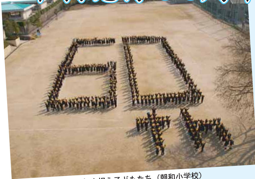
▲人文字で市制60周年を祝う子どもたち（朝和小学校）

昭和29年4月1日に天理市が誕生してから、今年で60周年。豊かな自然と歴史・文化に支えられ、市民の皆さんとともに発展してきました。これから本市の更なる未来に向かって、皆さんとともに歩んでいきます。