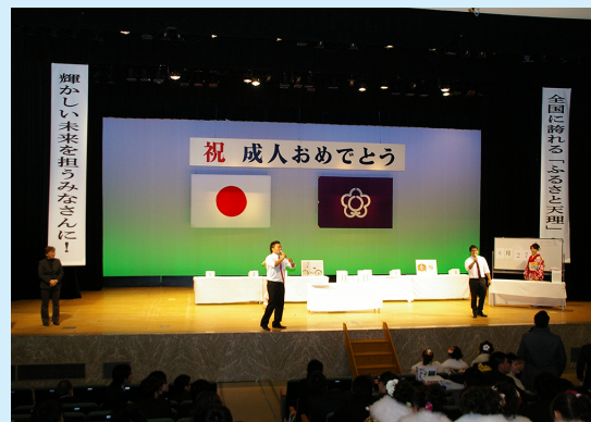
▲昨年の成人記念式の様子