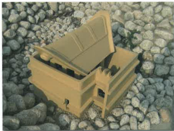
水の祭祀場・囿形埴輪