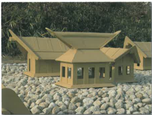
倉庫と住居 (手前11号・向う7号)