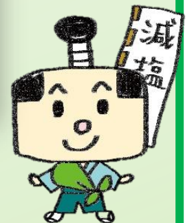
奈良県減塩キャラクター げんえもん